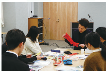
学生に企業の魅力を伝える交流会の様子

奈良県内の企業の事業内容に関する紹介や、そこで働く社会人と学生が交流できる機会を提供しています。奈良への定住や就職を目指す学生の増加を図ります。