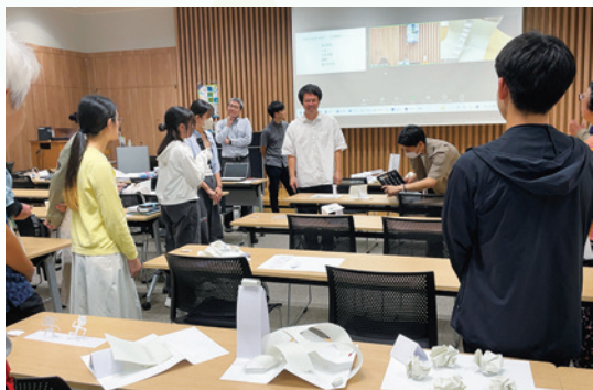
学問祭の講義風景

奈良の大学に通う学生に、学問の面白さや奥深さを感じてほしいという願いから生まれた教育イベントです。奈良が誇る伝統文化や芸術遺産をはじめ様々な学術分野における最先端の知見を「一講義完結方式」で受講者に提供しています。学問祭は機構が主催・運営していますが、両大学に「諸学への誘（いざな）い」という教養科目を設置し、各大学で単位認定を行っています。令和7年度からは、プラットフォームに参画する大学等と連携し、奈良市内の大学等の学生も参加できるようになり、また、県内の高校生も聴講できるようになりました。その他、企業と学生の交流会等、地域を盛り上げるためのイベントを同時開催しています。