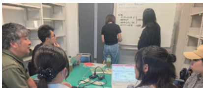
学生とのプロジェクトの打合せの様子

地域の学生や団体が企画する地域振興プロジェクトの立ち上げや推進及び社会実装をデザイン思考のプロセスを用いて支援し、地域活性化につなげます。