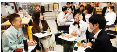
学生と企業の交流会の様子

大学生などの学生が、地域の住民や団体、自治体、企業と交流・協働することで、地域課題の解決や、新たなビジネスを創出する活動を促進しています。