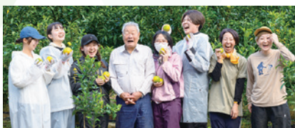
つちのこアンバサダーズ

地域に関心を持ち、地域活動に積極的に関わる学生の育成を通じて、ゆくゆくは学生と地域がともに地域課題の解決に向けて取り組む地域活性化モデルを構築します。