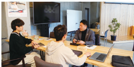
メンタリング支援実施の様子

経験豊かなメンターを配置し、メンタリングによる学生への伴走型支援を実施しています。学生が、奈良県内で地域活性化や地域課題解決を目的に取り組む活動における、活動計画策定や仲間づくり、活動に必要な情報を提供します。