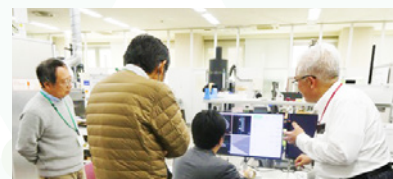
デモンストレーション