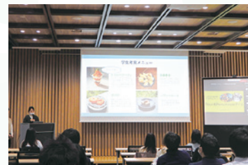
学生の活動発表時の様子

奈良県内の特色ある学生活動を広く情報発信することで、学生活動の可能性、更なる支援策を考え、今後の取り組みの発展を図ります。