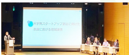
令和5年度のシンポジウムの様子

大学発スタートアップの創出を推進するための大学・自治体・地域企業の連携に関し、先行事例を調査し、産地学官連携PFにおけるあり方を検討しています。